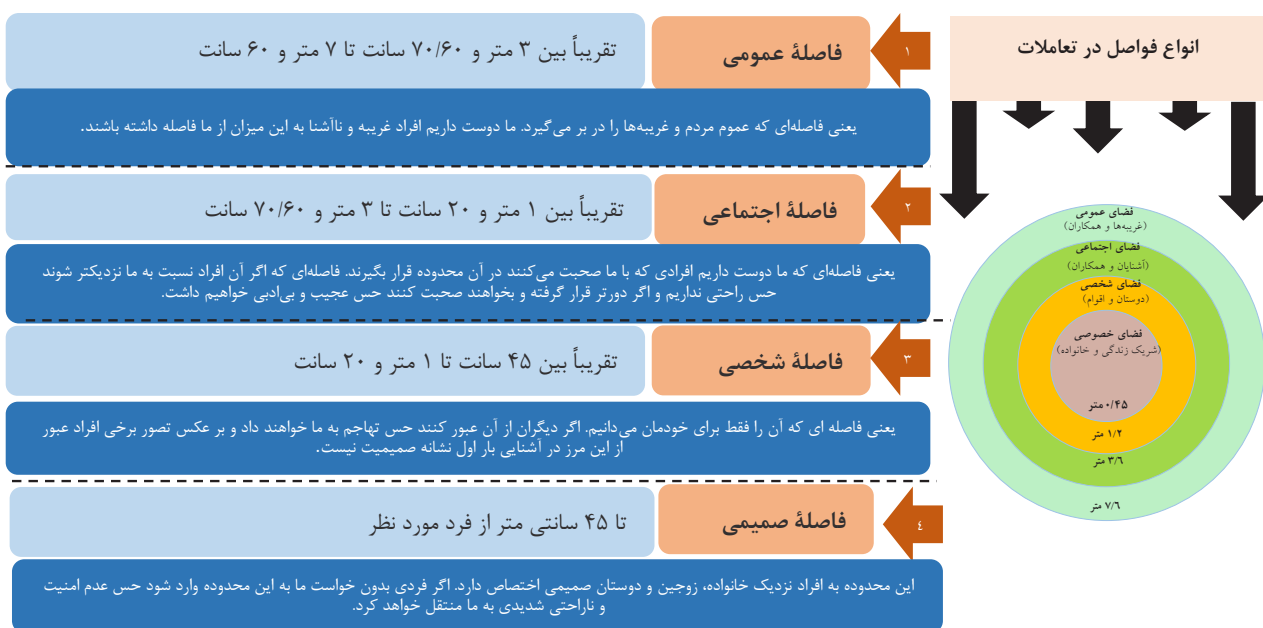
تصویر ۱. بررسی نسبت میزان فواصل در فرایند ادراک حریم.

ارزیابی برای ادغام تجربه در الگوهای معنی‌دار و اعمال شخصیت در وقایع، ارتباطات محدود و محافظت‌شده برای تعیین مرزهای بین فردی و به اشتراک گذاشتن اطلاعات شخصی با افراد قابل اعتماد (Trepte & Reinecke, 2011, 10). در رویکرد «آلتمن»، سه ویژگی حفظ حریم خصوصی مهم است. اول آن‌که، حریم خصوصی ذاتاً یک فرایند اجتماعی است. دوم، درک صحیح از جنبه‌های روان‌شناختی حریم خصوصی باید شامل تعامل مردم، دنیای اجتماعی آنها، محیط فیزیکی و ماهیت زمانی پدیده‌های اجتماعی باشد و سوم، حریم خصوصی یک زمینه فرهنگی دارد. به طور خاص، حریم خصوصی یک فرهنگ جهانی است اما مظاهر روان‌شناختی از نظر فرهنگی خاص است (آلتمن، ۱۳۸۲). آلتمن، قلمرو مکانی را نه تنها تأمین‌کننده خلوت، بلکه تثبیت‌کننده روابط اجتماعی می‌داند. حذف حریم و قلمروها، منجر به از بین رفتن خلوت، احساس تنش و تعارض در انسان و همچنین مشکلات روانی ناشی از ازدحام می‌شود. همچنین می‌توان فضای شخصی را حریم تعریف‌شده برای فرد معنی‌کرد که متعلق به وی است و ورود دیگران به آن ممنوع تلقی می‌شود. در فضای شخصی امکان ایجاد «تعریف حریم» فراهم می‌شود و می‌توان بیان کرد که با مفهوم حریم، استقلال فردی نیز تأمین می‌شود (لنگ، ۱۳۸۱، ۱۶۶)، لذا می‌توان چنین بیان کرد که ادراک حریم برای انسان براساس دو رویکرد شکل می‌گیرد، در حالت اول به صورت عینی به واسطه مرزبندی میان عرصه‌های مختلف فضایی رقم می‌خورد و در حالت دوم به صورت ذهنی و فرایندی که در مغز پردازش می‌شود (Raine, Stéphanie, Christen, Mégevand, & Fournere, 2022). لذا براساس آنچه بیان شد می‌توان ساختار حریم را به