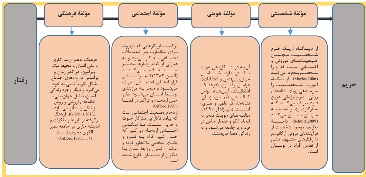
تصویر ۳. عوامل مؤثر بر رفتار اشخاص در فضاهای حریم‌گذاری شده.

به‌طور کلی و همچنین با فرض مصونیت بصری فرد، مورد سنجش قرار گرفته است. در این قسمت افراد در هریک از سؤالات و با انتخاب یکی از سه گزینه «رابطه مستقیم»، «رابطه معکوس» و «تأثیری ندارد»، رابطه عامل مشخص شده را با میزان حس حریم، تعیین کرده‌اند. در این قسمت نیز همچون بخش اول، نتایج با تفکیک جنسیت و مجموعاً مورد بررسی قرار گرفته است. بدین منظور جهت روشن‌تر شدن نتایج برای هر سؤال دو نمودار ترسیم شده است. نمودار اول آرای مجموع را در سه گزینه مذکور نشان می‌دهد و نمودار دوم، سهم هر گزینه را به تفکیک جنسیت نیز تصویر کرده است (تصویر ۴). در نهایت تلاش نیز تلاش شده است تا پس از تحلیل هر بخش، قیاس بین دو بخش نیز صورت گیرد.