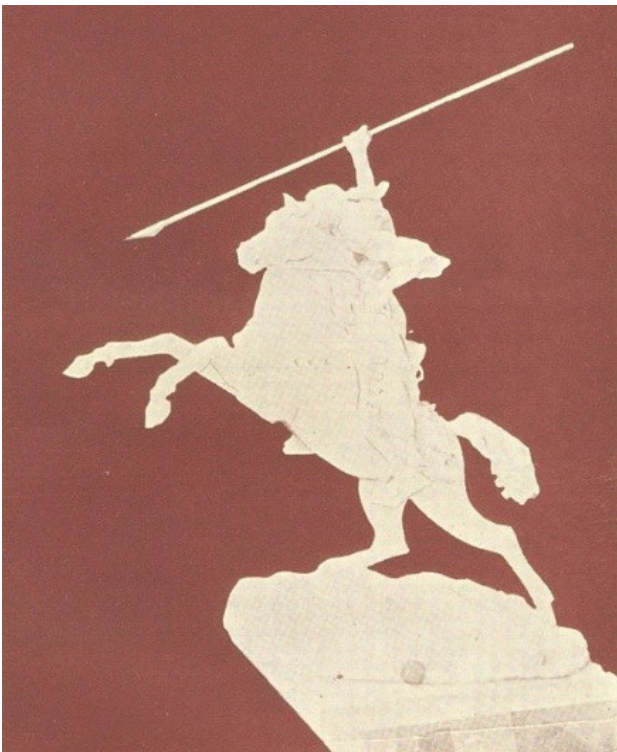
تصویر ۱. خاوالا پسر الازوار. مختار، ۱۹۱۰.

محمود مختار (۱۸۹۱-۱۹۳۴) را می‌توان مهم‌ترین نماینده این نوع ملی‌گرایی دانست. وی به عنوان برجسته‌ترین مجسمه‌ساز مدرن مصر، در سراسر زندگی حرفه‌ای خود بین قاهره و پاریس در رفت‌وآمد بود. سگرم‌ن او را یک نماینده خوب از مصر مدرن می‌نامد (Seggerman & Mukhtar, 2014, 31).