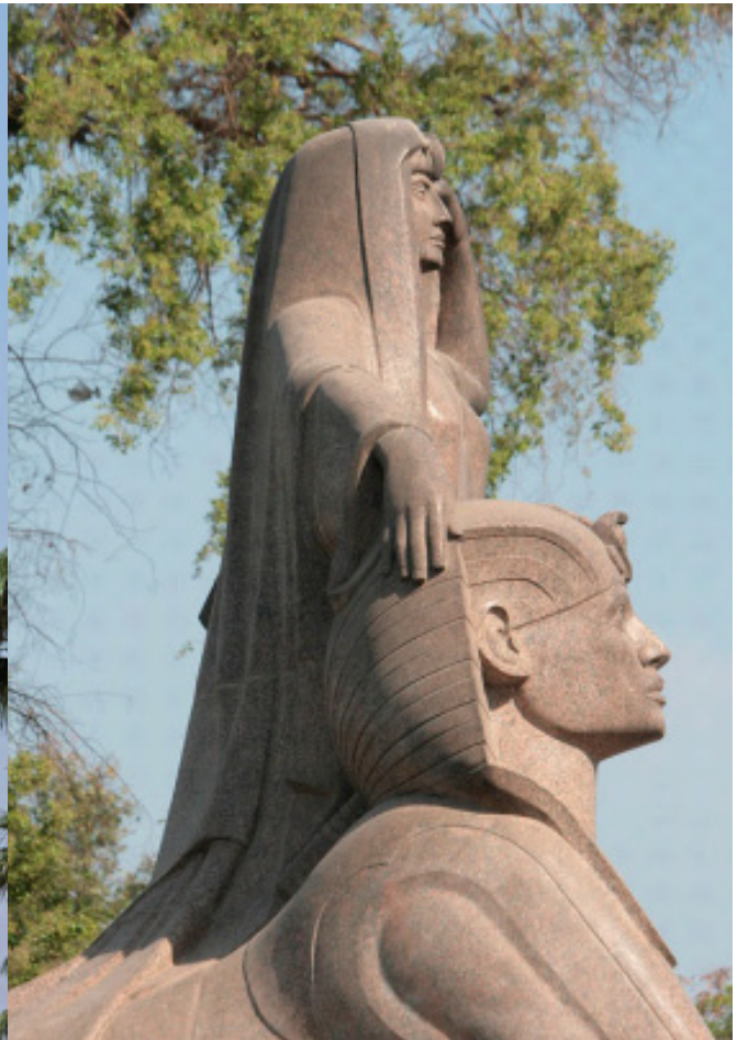
تصویر ۲. محمود مختار، مجسمه بیداری مصر ۱۹۲۰-۱۹۲۸. مأخذ: Seggerman & Mukhtar, 2014.