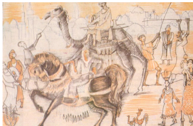
تصویر ۳. حومه شهر، راغب ایاد، ابرنگ روی کاغذ، ۷۰×۵۰ سانتی‌متر، ۱۹۲۵.