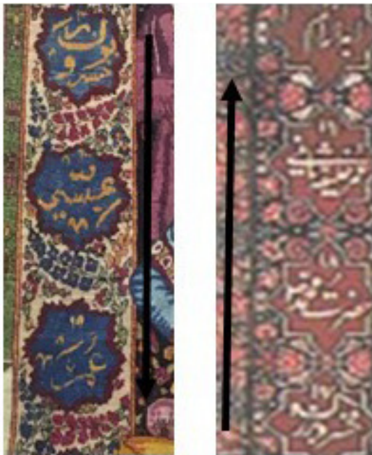
تصویر ۹. راست: قسمتی از حاشیه قالی‌های موجود در موزه فرش؛ چپ: قسمتی از حاشیه قالی‌های موجود در موزه کاخ نیاوران. مأخذ: آرشیو نگارندگان.

مسیحی، سفارشی توسط مسیحیان بوده یا هدیه‌ای به آنان باشد. لذا تقلیل یافتن آگاهانه موقعیت‌های صحنه و کارکرد این حق تقدم، بر تقویت این انگاره که وولف از آن به عنوان احاطه موضوع و قدرت با محور زیبایی‌شناسی یاد می‌کند، تلاقی جدل برانگیزی است که قابلیت تأویل معنایی گوناگون رامیسر می‌کند.