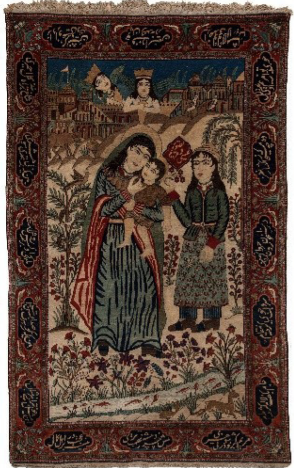
تصویر ۸. کاشان، ۲۷۰×۱۳۰ سانتی‌متر، فرش محتشم کاشان، حضرت مریم و مسیح (ع)، دوره قاجار. مأخذ: https://www.essiecarpets.com/product/mohtashem-kashan/

هر اثری به مثابه تولیدی است که با توجه به اظهارات جانت ولف