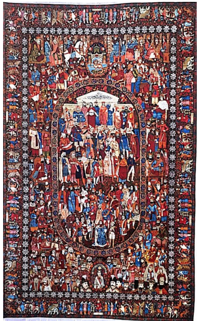
تصویر ۱. قالیچه مشاهیر، قرن ۲۰، محفوظ در کاخ نیاوران

نسبت اول، A با C نسبت به نقطه M (مرکز فرش) قرینه است (تصویر ۴، نمونه ۱). نسبت دوم، B با C نسبت به محور X۱، و B۲ با A۲ نسبت به محور X۲ قرینه است (تصویر ۴، نمونه ۲).