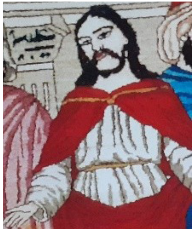
تصویر ۱۰. جزئی از تصویر قالی محفوظ کاخ نیاوران، حضرت عیسی (ع) و نام وی بر ستون نزدیک آن.