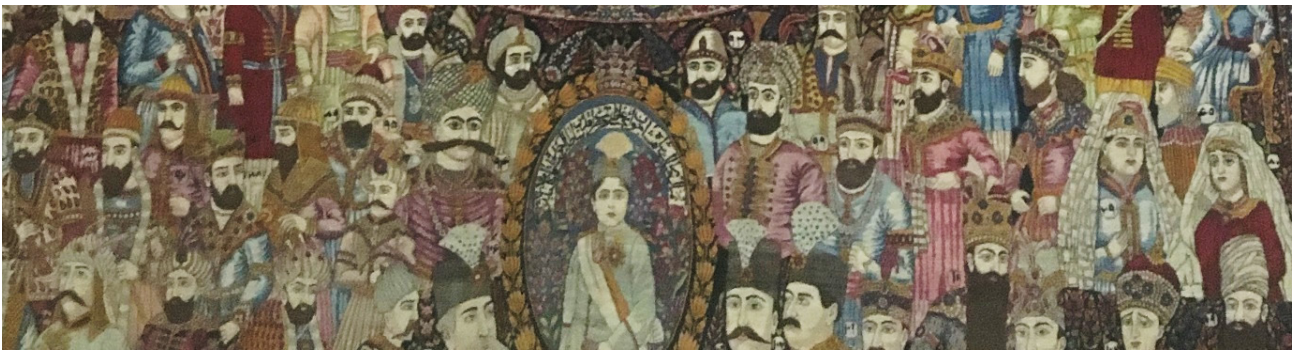
تصویر ۶. جزئیاتی از تصویر پادشاهان ایران که به احمدشاه ختم می‌شود.