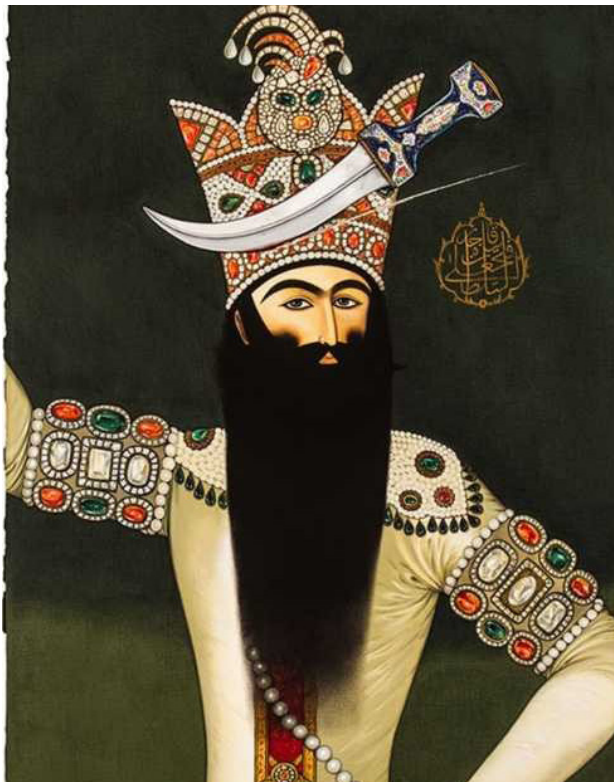
تصویر ۱. از مجموعه خاطرات انهدام، آغداشلو، ۱۳۹۲، گواش و آبرنگ روی مقوا. مأخذ: https://www.artchart.net .

اردشیر محمص با توجه به روش‌های فنی گرافیک - ویژه دوره قاجار - و ادغام آن با هنر معاصر، به زبانی بسیار آشنا، تلخ، سیاه، مستقل و خاص دست پیدا می‌کند. او با طرح‌هایی از طنز سیاه و پر از هاشورهای ریز، با جابجایی بخش‌های مختلف اندام انسانی، با نگاهی تند به دوران قاجار می‌تازد. در برخی از آثارش وقایع‌نگاری عصر تملق و شمایل قاجاری، برای او تمثیلی بیش نیست. اردشیر محمص درامی را به تصویر می‌کشد که تضادی است میان جریان مدرنیته‌سازی و شخصیت‌ها و آداب و رسوم که نشان از سنت‌های قاجاری دارد. کاریکاتورهای طراحی‌وار او، نشان از تقابلیش در برابر توحش زمانه، اختلاف طبقاتی و بحران‌های سیاسی است که به دور