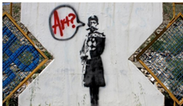
تصویر ۵. آرت، نامعلوم، گرافیتی روی دیوار، مأخذ: www.gaffiti.com .

و نقش مایه‌های سلجوقی و قاجاری است (تصویر ۷). به بیان خود هنرمند با به کارگیری این ویژگی‌ها سعی در نشان دادن هویت ایرانی داشته است. پرویز کلانتری نیز در آثارش (تصویر ۷) به نوع دیگری از عناصر آشنا و ویژه دوره قاجار بهره‌برداری کرده است. صادق تبریزی از دیگر هنرمندان این دوره است که از تلفیق پیکره‌های صفوی و قاجاری و عناصر تزئینی این دوران آثاری را به تصویر کشیده است.