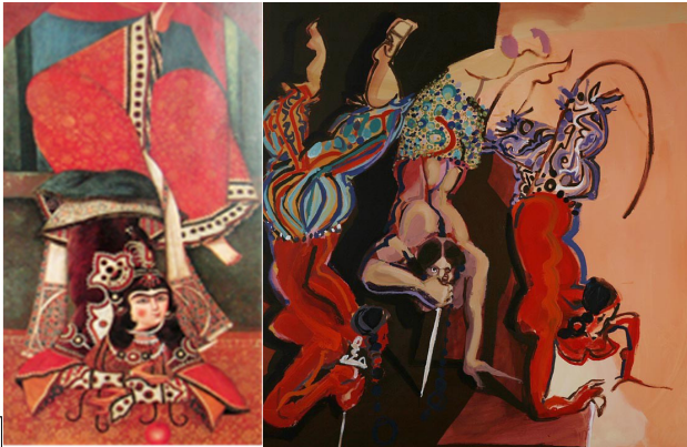
تصویر ۱۱. راست: بدون عنوان، رکنی حائری‌زاده، اکریلیک روی بوم؛ چپ: زن در حال حرکات نمایشی، منسوب به احمد، دوره قاجار، رنگ و روغن روی بوم.