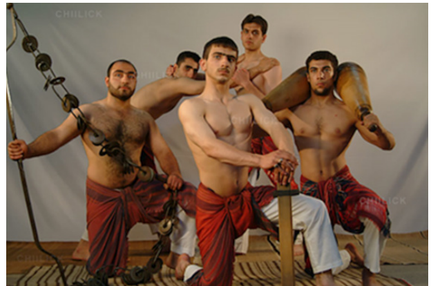
تصویر ۱۰. پهلوانان، صادق تیرافکن، عکس. مأخذ: www.chilick.com .