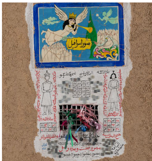
تصویر ۸. سقاخانه، پرویز کلانتری، ترکیب مواد.