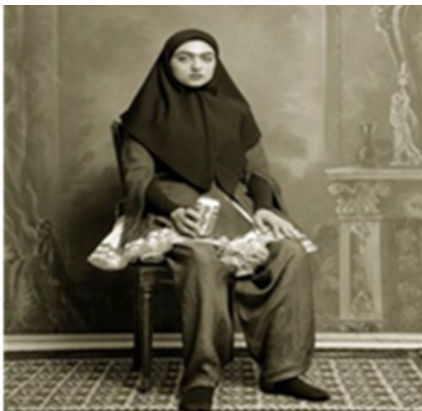
تصویر ۴. آلبوم قجر، شادی قدیریان، ۱۳۷۸.