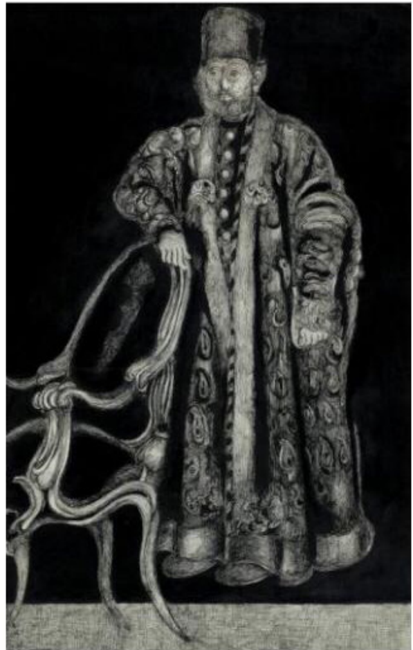
تصویر ۲. شاهزاده قاجار، اردشیر محمص، ۱۳۹۲، قلم آهنی و مرکب روی مقوا.

از کارهای جلالی تدوین و اصلاح نگاتیوهای شیشه‌ای گنجینه کاخ گلستان بود که با نگاهی متفاوت، با مونتاژ عکس‌های مربوط به دوره قاجار، مجموعه آثاری با عنوان «تصویر خیال: سیاه و سفید» و در ادامه «تصویر خیال: قرمز» را به وجود آورد. این آثار، در نگاه نخست ارجاع مستقیمی به دوره قاجار دارند که برای مخاطب آشناست اما در لایه‌های دیگر، نشانی از گرافیک، نقاشی و خط‌نوشته‌ها با بیان نمادین دیده می‌شوند. آنچه این مجموعه آثار را در رده هنر معاصر قرار می‌دهد، بازتاب دوره قاجار نیست بلکه برقراری پیوند تصویر با ادبیات و یادآوری مسائل فرهنگ ایرانی است که از ویژگی‌های مهم این مجموعه به شمار می‌رود (تصویر ۳).