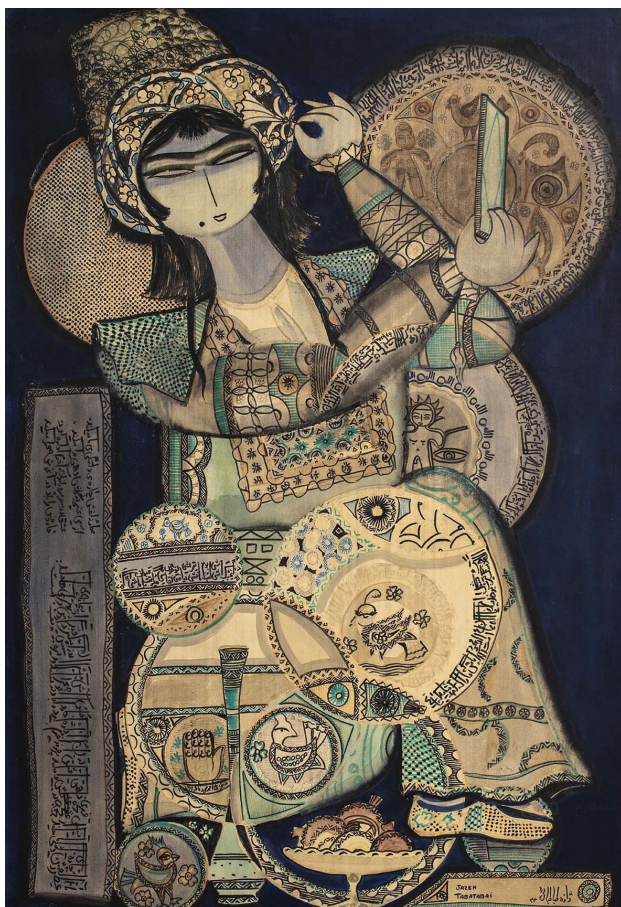
تصویر ۶. بدون عنوان، ژازه طباطبایی، رنگ و روغن، ۱۳۴۳.