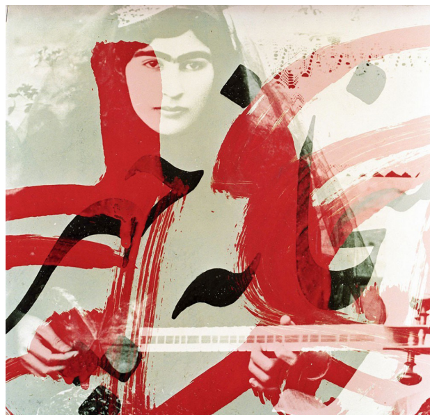
تصویر ۳. تصویر خیال، بهمن جلالی، ۱۳۸۰. مأخذ: www.akkasee.com .